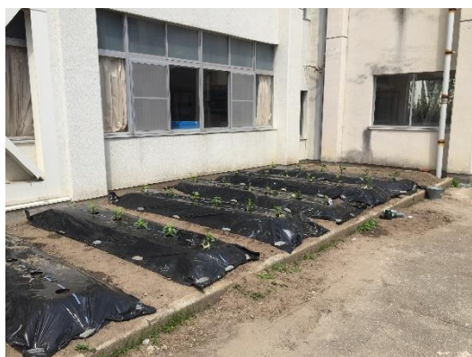
（写真2）定植後（ナス、ピーマン）

まだまだ収束の目途が立たず、不安でしょうが、自分たちができること（手洗い・うがい・咳エチケット・不要不急の外出自粛など）をやっていきましょう。そして、学校再開に向けて、体調を整えておきましょう。