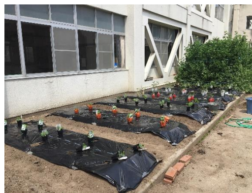
（写真3）定植前（トマト、キュウリ、ゴーヤ）