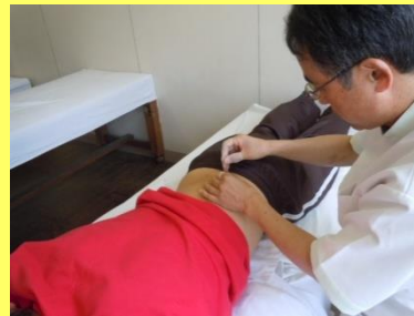
<理療基礎実習（はり）>