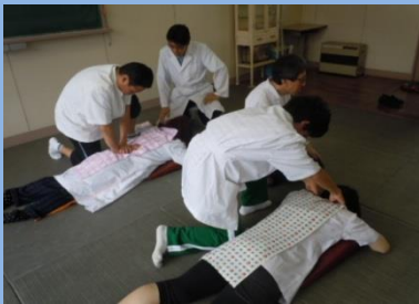
<理療基礎実習（指圧）>